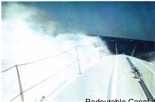
Redoutable Canal de Sardaigne, traversée Sardaigne Tunisie, en moins de 3H)