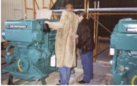
2 moteurs Turbo diesels VOLVO Penta 2x 770 CV