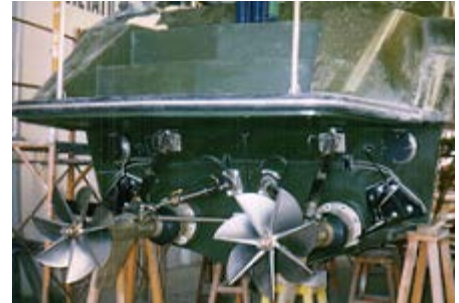
Transmissions ARNESON ASD-10 Hélices Rolla 6 pales

Vitesse de 45 Noeuds à seulement 1.700 tours mn.(Cf Fiche de test en mer)